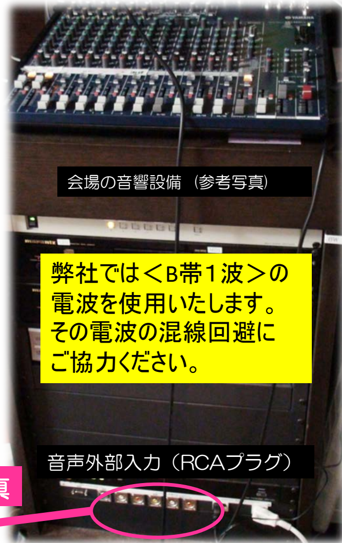
会場の音響設備 (参考写真)

弊社では<B帯1波>の電波を使用いたします。 その電波の混線回避にご協力ください。